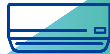
エアコン買い替え

2027年、国の省エネ基準強化により、現在使用中のエアコンの多くが今後修理・買い替え対象になる可能性があります。また、2026年から徐々に生産調整が始まるのではないかとされています。古いエアコンは電気代が高く、故障時に部品供給が受けられないケースも増えています。快適さと安心のために、補助がある今こそ最新エアコンへの交換がおすすめです。