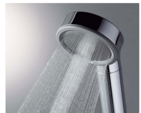
シャワーの強さや心地よさはそのままに節水を実現 バスルーム:W水流シャワー

今なら浴室リフォームや対面式キッチンへのリフォームなどで「こどもみらい住宅支援事業」補助金が申請できる場合があります!