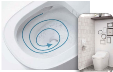
流すたびに泡で汚れを落としてくれるから、おそうじの手間を軽減 アラウーノ