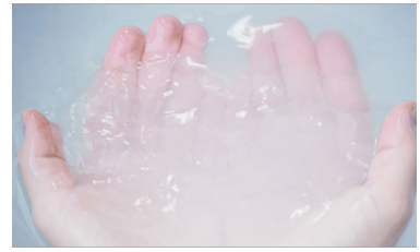
酸素のお湯で身体のぼかぼかが続き、お肌のしっとりも長続き バスルーム:酸素美泡湯