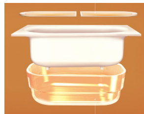
浴槽とフタに断熱材を使用し高い保温効果を発揮 バスルーム:保温浴槽