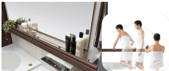
洗い場での立ち座りや浴槽の出入りなどをサポートする手すりの内側はボトルや小物類の収納スペースに リフォーム:おきらく手すり