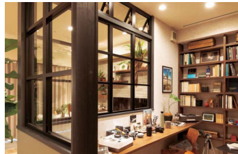
光や風を取り込める室内窓で、ゆるやかなつながりのある空間 ベリテイス:室内窓