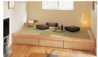
リビングの一角に畳コーナーをつくり収納・くつろぎのスペースに 畳が丘