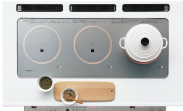
3つの料理が同時にしやすく、手前のスペースでもりつけも楽々 トリプルワイドIHコンロ